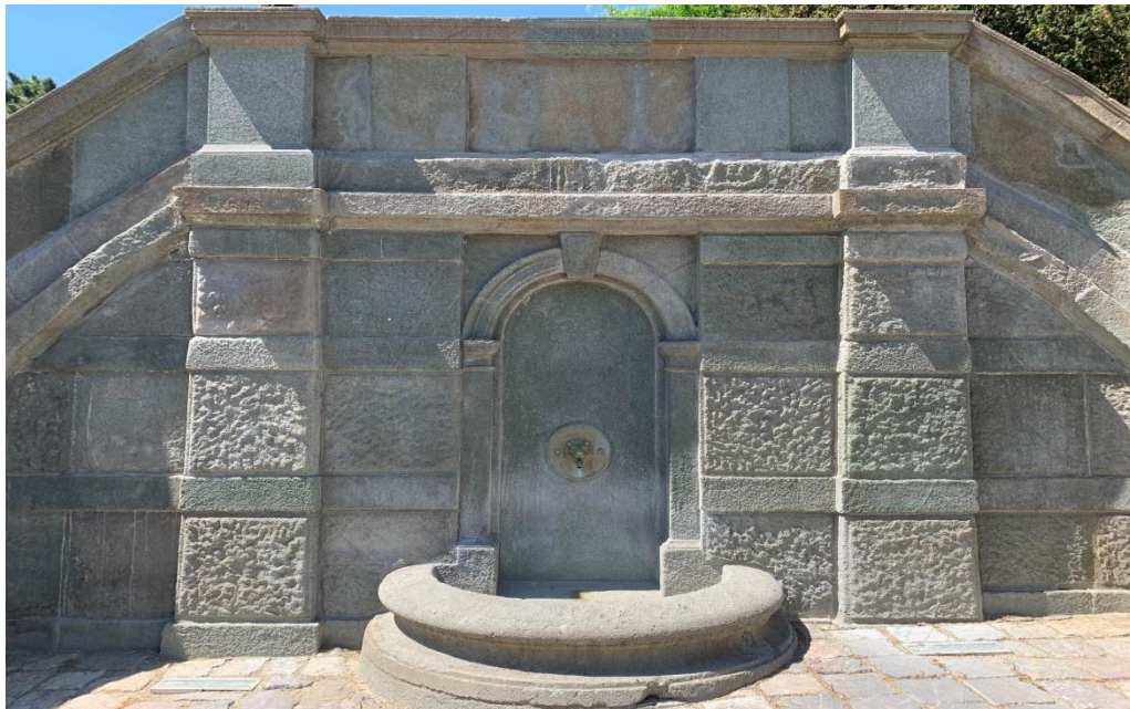
Слике 11, 12. и 13. Мало степениште на Калемегдану