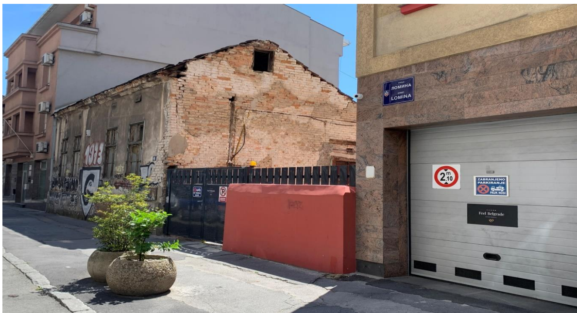
Слике 3, 4. и 5. Приватна кућа Зорке Арсенијевић, Ломина 46