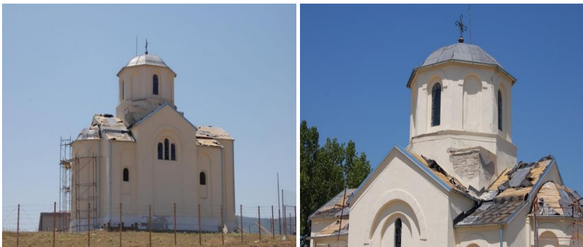
Слике 1. и 2. Храм Св. Архангела Михајла у Штимљу

Споменичким комплексом на Теразијама под радним називом „Алегорија“, повереним Ивану Мештровићу, требало је да на фонтани – чесми доминира скулптура Победника, уметничка интерпретација југословенства. Наго тело мушкарца изазвало је огромну полемику 17 и поделу Београђана и Победник је тек после рата завршио на Калемегдану, како не би изазивао стид женске младежи. Тим поводом, Друштво „Књегиње Љубице“ конзервативно је, бранећи морал друштва, припретило протестима ако се статуа Победника постави на Теразијама. Ксенија Атанасијевић, тадашња професорка Београдског универзитета, пак, изјавила је тада, уз жаљење због необразованости средине: „Колико би се ова данашња анкета чинила близу памети старим Грцима чије су најшире масе осећале дубоки пијетет према многим статуама Фидије, Пракситела...“. О подељености београдске јавности поводом тог догађаја извештава београдско Време . 18 О откривању споменика на Калемегдану пише Политика . 19