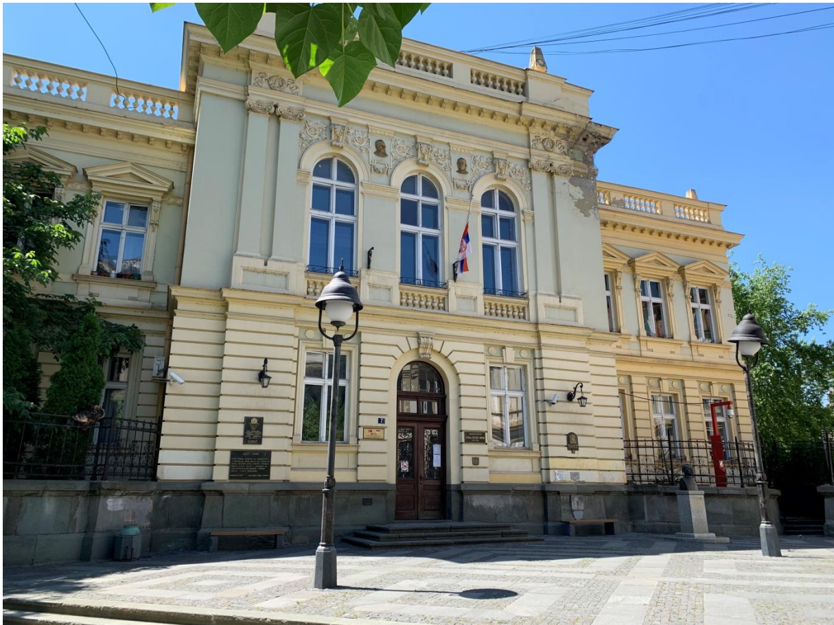
Слика 8. ОШ Краљ Петар Први